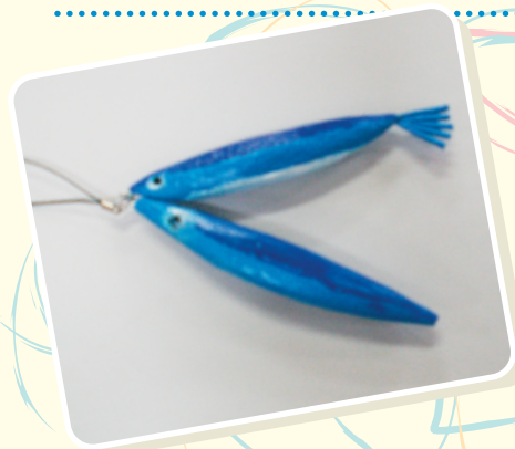
【ルアー】趣味は釣り！ルアーを彫ってみました。

患者さんの趣味・特技を作業療法にとり入れています。素敵な作品が続々完成しています。