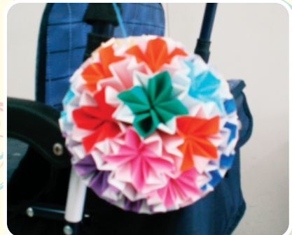
【折り紙飾り】「時間かった〜」