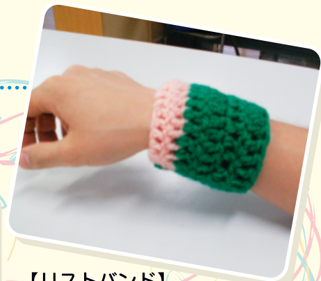
【リストバンド】20年ぶりに製作