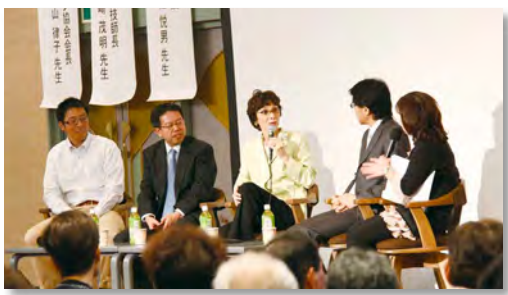
▲講師の方々による座談会 会場からは健康に関する質問が多く寄せられました

最後に、当日の講師3名に当院の村副院長も加わり、「自分に合った運動で、イキイキ活動的な毎日」をテーマに座談会を行いました。会場の参加者からの質問にも答えるなど、ステージと会場が一体となったアットホームな座談会となりました。