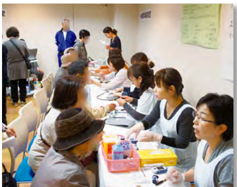
▲健康フェア血圧・血糖測定コーナー 検査の結果を看護師が説明しました

セミナーに先立ち、当院職員による健康相談などの「健康フェア」を実施しました。血圧や血糖測定、骨粗鬆症のリスクを測る骨密度測定や、血管年齢、肺年齢測定検査、体力測定、最新の電動車椅子の試乗体験、リハビリ用のロボットスーツの体験コーナーなどに大勢の方のご参加をいただきました。