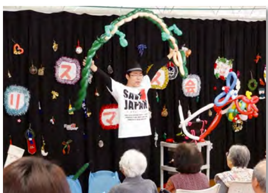
▲バルーンアートの披露 大きな今年の干支「龍」を作ってくれました

12月3日(土)ボランティア会主催による毎年恒例のクリスマス会を開催しました。毎年「フラダンス」「踊り」「民