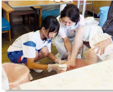
▲入院患者さんの足を洗うお手伝い 患者さんからお礼の言葉も頂きました

9月7日～8日に明野中学校の生徒さん、9月14日～15日に大東中学校の生徒さんが学校の授業の一環として職場体験学習にやってきました。