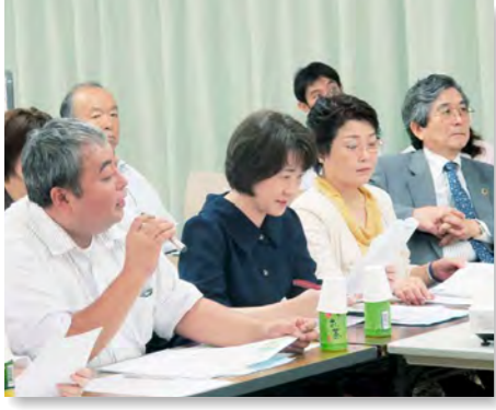
▲審査員からは時折厳しい意見もいただきましたが、一つ一つが現在の研究をより良いものにするための貴重な意見でした

審査員には院外からも来賓をお招きし、様々な視点から審査、ご指導を頂きました。お忙しい中ご参加をいただきありがとうございました。