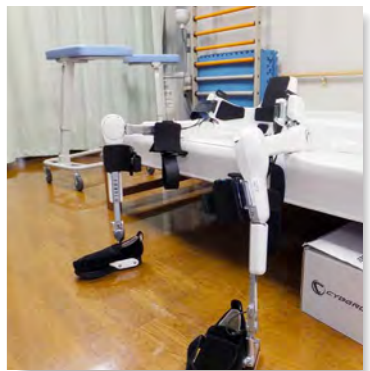
▲下肢用のロボットスーツHAL コンパクトな作りで患者さんを 確実にサポートします

「ロボットスーツHAL」は、筑波大学大学院教授である山海嘉之氏が開発した歩行支援の下肢用ロボットスーツです。原理としては、人が筋肉を動かさずとした時に生じる活動電位をとらえて筋肉の動きを