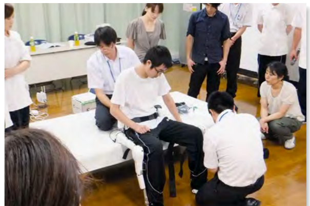
▲当院の職員も実際に装着してデモも実施しました