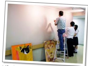
▲絵の掲示場所や順番などを入念に打ち合わせ