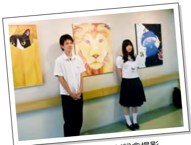
▲作品と一緒に生徒さんが記念撮影 皆さんご協力ありがとうございました

大分高等学校と当院ボランティア会のご協力により、同校美術専攻クラスの生徒の皆さんの作品を展示しています。3階回復期リハビリテーション病棟の本館と東館の連絡通路に展示スペースを設け、いずれも力作の絵画を鑑賞することができます。運営をボランティア会にお話しいただき、今後とも定期的にテーマを変えて作品も入れ替える予定です。高校生の自由なみずみずしい才能を是非ご鑑賞ください。